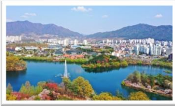
忠州(チュンジュ)市の様子

私は韓国の忠清道(チュンチョンドウ)にある忠州(チュンジュ)市の出身です。ソウルまで高速バスで1時間半くらいかかります。方言はなくソウルと同じ標準語で話します。忠清道はのんびりした人が多くゆっくり話します。リングと温泉が有名です。温泉は水安堡(スアンボ)というところで、朝鮮時代には王様も利用していたといわれています。