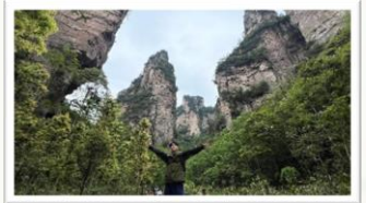
岩の柱が立ち並ぶ武陵源の景色

中国は現在59もの世界遺産を有し、これは世界第2位の数です。私はこれまで6か所訪れましたが、中でも最も印象に残っているのは湖南省張家界市(ちょうかかいし)にある武陵源(ぶりょうげん)です。広大な森林の中にたくさんの岩の柱が立ち並ぶ様子は、映画「アバター」の世界のようで、大昔にタイムスリップしたような気持ちになりました。さらに、付近には、地上約300mの高さ、全長約430mのガラスの橋や約330mの最も高い屋外エレベーターなど体験したことのないことばかりで驚きの連続でした。