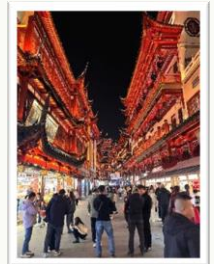
上海の観光地：豫園

上海で生活を始めて3週間経つのですが、上海に来て日本語を聞いたり見たりする回数が南京より増えたと感じます。南京には少なかった日本料理店も至る所にあり、日本語で注文できるお店があることに感動しました。しかし、まだまだ、鹿児島県を知っている中国の方は少ない気がします。多くの方々に鹿児島県の産品や観光地の魅力を知ってもらい、上海—鹿児島間の航空機の利用や県産品を購入してもらえるようなPR活動に励みます。